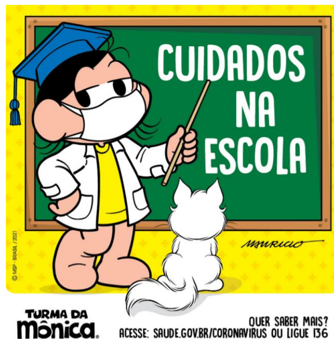
Imagem e apostila no link:

Caso precise de mais informações a Turma da Mônica poderá ajudar com dicas de cuidados na escola. É só acessar a apostila no link abaixo.