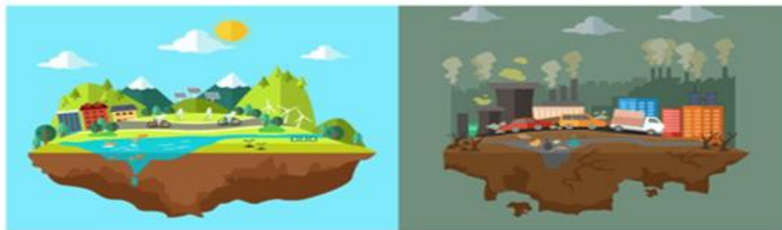
Conceituando poluição

As duas imagens apresentam modificações causadas pela ação do homem.