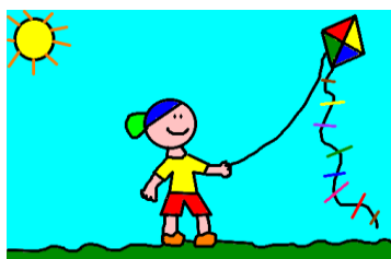
O menino solta pipa.