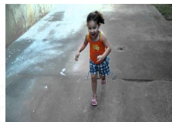
A criança corre .

➡ Observe que as palavras: solta, pula e corre são ações ( verbos )