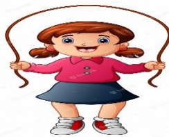
A menina pula corda.