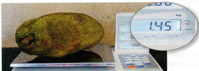
Jaca sendo pesada.