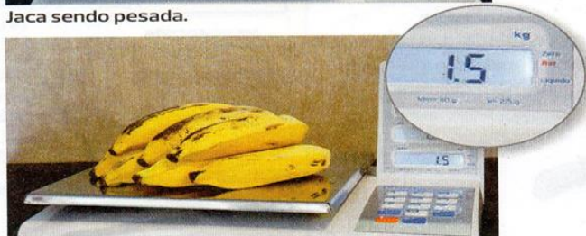
Bananas sendo pesadas.