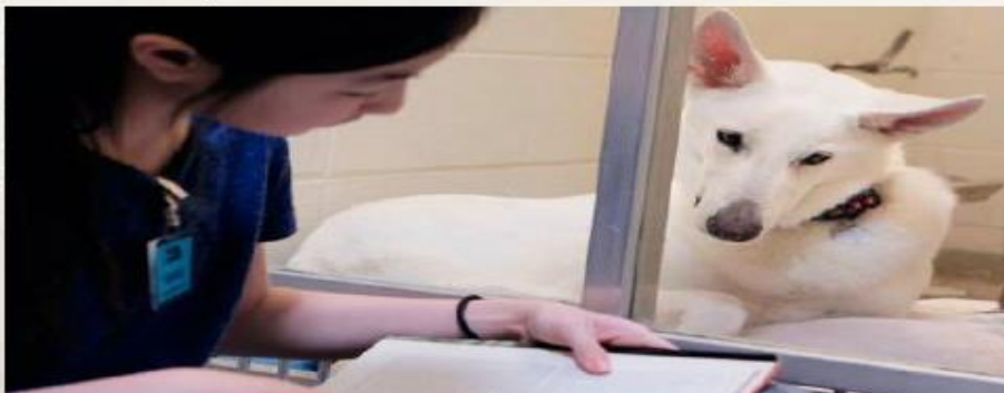
Menina lendo para um cachorro em um abrigo de animais.

A Sociedade Humana de Missouri, que cuida de cães abandonados nos Estados Unidos, criou um projeto para crianças e adolescentes entre 6 anos e 15 anos lerem para cachorros. Antes de começar, os jovens fazem um treinamento de uma hora e meia para aprender sobre cães abandonados. Depois, as crianças voluntárias decidem se preferem levar um livro de casa ou escolher um exemplar da livraria do local. Criado em 2015, o projeto traz benefícios para crianças e cães. Os cachorros ficam menos ansiosos e agitados e aprendem a interagir com as pessoas, aumentando as chances de serem adotados. Ao mesmo tempo, as crianças melhoram as habilidades de leitura.