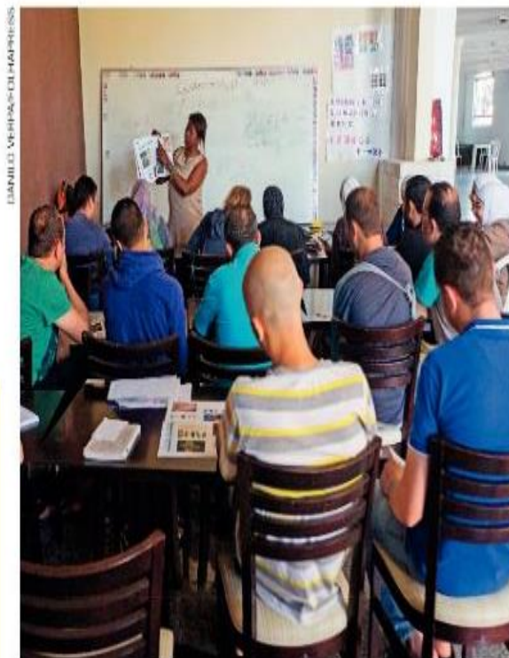
Sírios refugiados em aula de português. Município de Guarulhos, estado de São Paulo, 2014.

Unesco: migração é provocada por desejo de dignidade, segurança e paz. Nações Unidas no Brasil . 18 dez. 2017. Disponível em: < https://nacoesunidas.org/unesco-migracao-e-provocada-por-desejo-de-dignidade-seguranca-e-paz/ >. Acesso em: 18 dez. 2017.