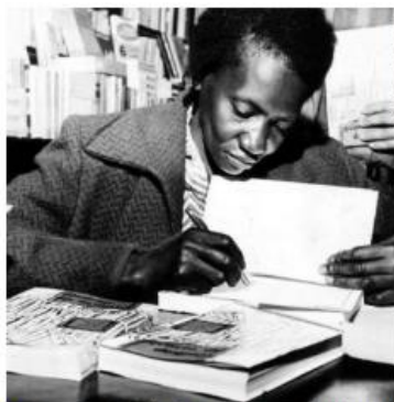
■ A escritora Carolina de Jesus. Fotografia de 1960.

ÁLBUM DE FIGURINHAS: APÓS A LEITURA, FAZER O DESENHO DOS PERSONAGENS DA HISTÓRIA.