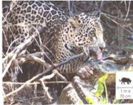
A ONÇA-PINTADA SE ALIMENTA DE OUTROS ANIMAIS, COMO CAPIVARAS E JACARÉS.

CADA SER VIVO TEM DE UM JEITO PRÓPRIO DE SE ALIMENTAR. VEJAMOS ALGUNS EXEMPLOS A SEGUIR. OS ANIMAIS SE ALIMENTAM DE OUTROS SERES VIVOS. OBSERVE AS FOTOS ABAIXO. O QUE OS ANIMAIS ESTÃO COMENDO?