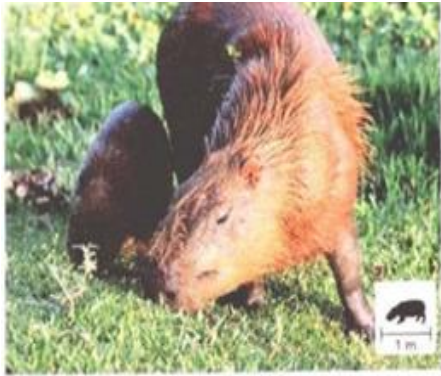
AS CAPIVARAS SE ALIMENTAM DE PLANTAS, COMO O CAPIM E A GRAMA.