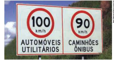
Placa em uma rodovia.

B) E PARA CAMINHÕES E ÔNIBUS? _____ KM/H