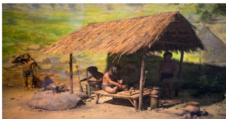
Reprodução em cera do estilo de vida do ser humano durante a Pré-História.

Em nossa aula de história vamos começar falando sobre os primeiros grupos humanos. Como será que as pessoas viviam há uns 10 mil anos atrás? Você já imaginou como seria viver numa época em que não existiam os recursos tecnológicos que temos hoje? Veja a imagem a seguir, observe os recursos que essas pessoas usavam para trabalhar e responda as questões.