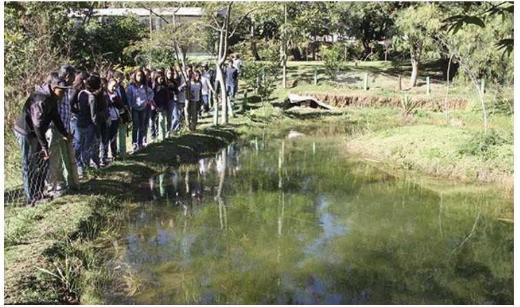
Fonte: Portal de Hortolândia: alunos visitam Parque Socioambiental Irmã Dorothy Stang, no Jd. Nossa Senhora de Fátima

Pesquisar por meio de imagens sobre o que é meio ambiente pensando na cidade de Hortolândia;