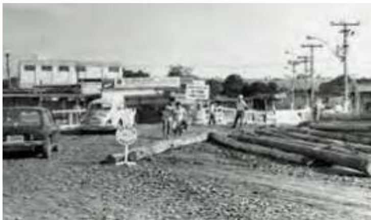
fotos tiradas no início da formação da cidade..