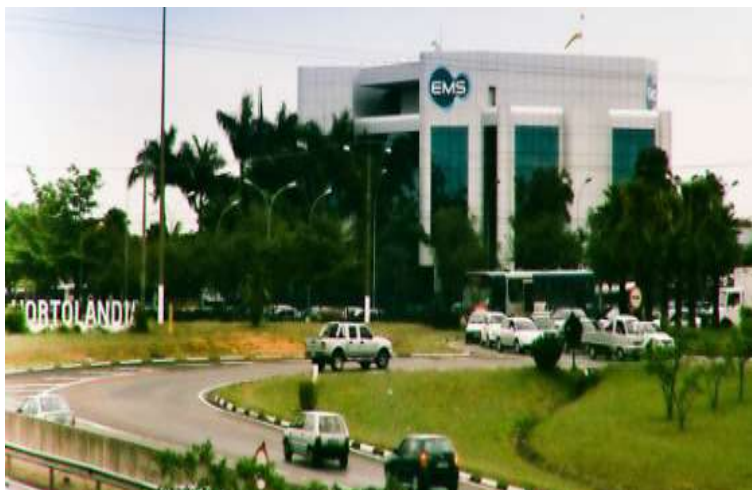
Imagem dos últimos anos.