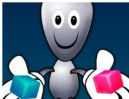
Separe as sílabas

LINK: https://www.escolagames.com.br/jogos/separeSilabas/