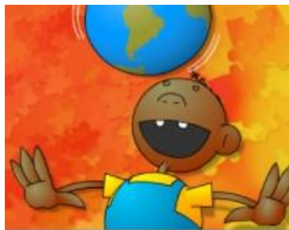
Quebra cabeça mapas

LINK: https://www.escolagames.com.br/jogos/pegaBolhas/