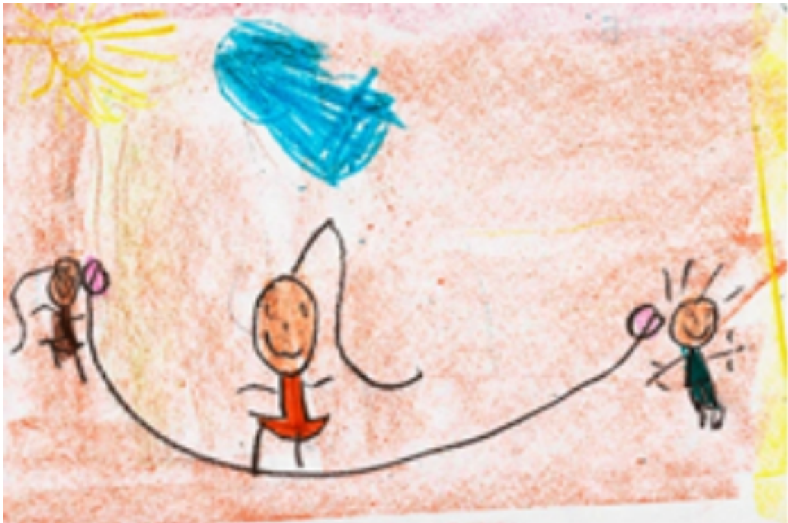
FIGURA 1: https://www.unbciencia.unb.br/biologicas/61-educacao-fisica/566-estudo-inedito-revela-que-midias-nao-substituiram-as-brincadeiras-infantiss

ATIVIDADE INTERDISCIPLINAR (HISTÓRIA, GEOGRAFIA E CIÊNCIAS): NAS DUAS ÚLTIMAS SEMANAS CONHECEMOS OU RELEMBRAMOS VÁRIAS BRINCADEIRAS (MASSINHA, CORDA, AVIÃO DE PAPEL, COELHINHO SAI DA TOCA, ETC). NOS DIVERTIMOS MUITO, MAS AGORA QUERO SABER QUAL DAS BRINCADEIRAS VOCÊ MAIS GOSTOU? VOCÊ PODE DESENHAR E ESCREVER NO SEU CADERNO A BRINCADEIRA QUE VOCÊ MAIS GOSTOU.