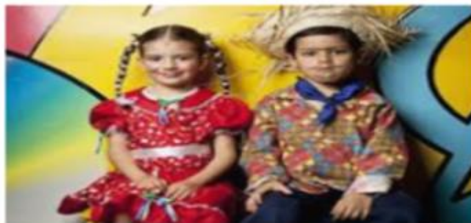
FIGURA 4: ACCESSORIZE.COM.BR

ATIVIDADE INTERDISCIPLINAR (HISTÓRIA, GEOGRAFIA E CIÊNCIAS): AGORA QUE VOCÊ JÁ ASSISTIU AO VÍDEO, QUERO TE PROPOR UMA COISA: VAMOS NOS FANTASIAR, COMO SE FOSSEMOS PARA UMA FESTA JUNINA? TIRE UMA FOTO E ENVIE PARA SUA PROFESSORA. ABAIXO UMA INSPIRAÇÃO PARA VOCÊ.