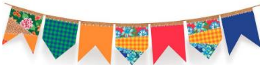
Figura 1: AMAZON.COM.BR

ATIVIDADE INTERDISCIPLINAR (HISTÓRIA, GEOGRAFIA E CIÊNCIAS): A FESTA JUNINA, É UMA FESTA POPULAR DO BRASIL. FAZ PARTE DA NOSSA CULTURA FESTEJAR EM JUNHO/JULHO ESSA FESTA TÃO COLORIDA E ANIMADA. DEPOIS DE VER O VÍDEO, FAÇA EM SEU CADERNO UM DESENHO DE UMA FESTA JUNINA, PINTE E USE O MATERIAL QUE QUISER PARA ENFEITAR SUA FESTA. ENVIE UMA FOTO PARA SUA PROFESSORA.