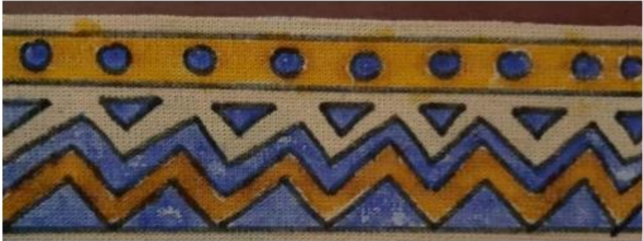
FIGURA 6: ACERVO PESSOAL PROFESSORAS 1º ANOS

ABAIXO TEM UM GRAFISMO COM INSPIRAÇÃO AFRICANA QUE A PROFESSORA ANDRÉIA FEZ.