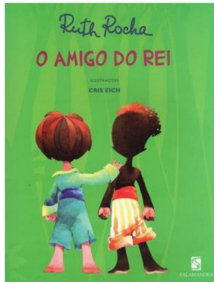
FIGURA 2: https://www.youtube.com/watch?v=M2Qh5YV37JQ

LÍNGUA PORTUGUESA: ESSA É A CAPA DO LIVRO DA HISTÓRIA DE HOJE. OUÇA A HISTÓRIA, OBSERVE E DEPOIS DESENHE A PARTE DA HISTÓRIA QUE VOCÊ MAIS GOSTOU: