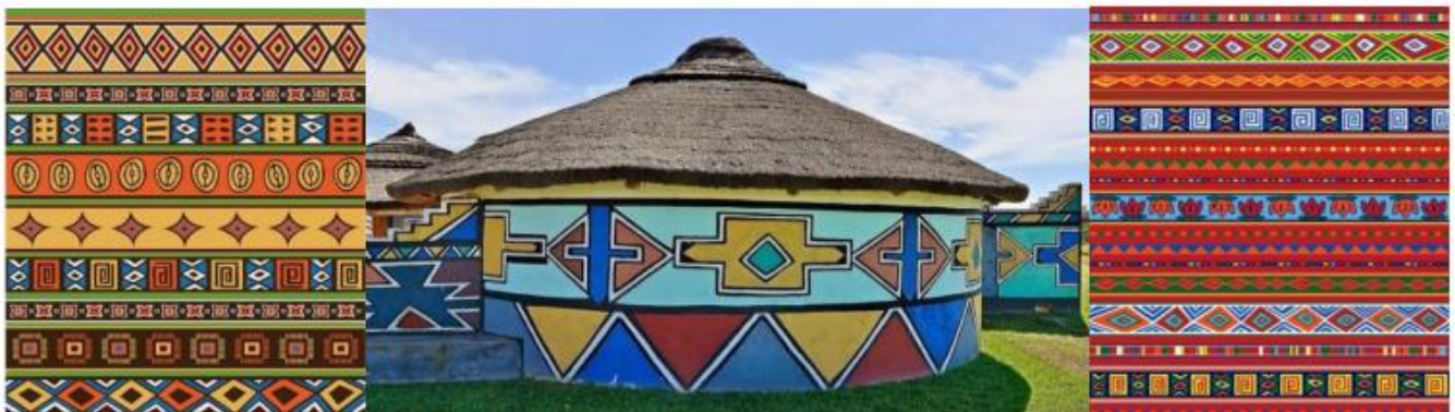
FIGURA 3: 1 https://br.pinterest.com/pin/733172014321822839/ FIGURA 4: https://br.pinterest.com/pin/404690716499258635/

MATEMÁTICA: GRAFISMO É UMA MANEIRA DE ESCREVER OU REPRESENTAR AS PALAVRAS DE UMA LÍNGUA, ALÉM DISSO É UMA MANEIRA DE DESENHAR. EXISTEM VÁRIOS TIPOS DE GRAFISMOS, HOJE VAMOS CONHECER ALGUNS GRAFISMOS AFRICANOS, QUE GERALMENTE SÃO BEM COLORIDOS E ESTÃO PRESENTE NAS ROUPAS, OBJETOS E ATÉ MESMO NAS CASAS. OBSERVE ABAIXO ALGUNS GRAFISMOS AFRICANOS: