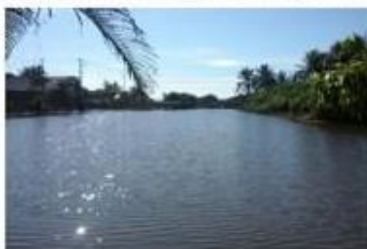
Lagoa do Baú