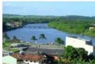
Rio Reis Magos

Disponível em: https://corujapedagogica.com/a-agua-no-planeta-terra-com-bncc-3o-ano/