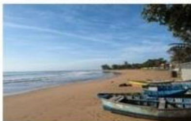
Praia de Manguinhos