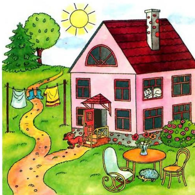
Figura 2- https://br.pinterest.com/pin/131871095322765971/