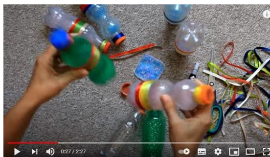
Chocalhos de garrafinhas

DISPONÍVEL EM: https://www.youtube.com/watch?v=V3PuMNNEAf0