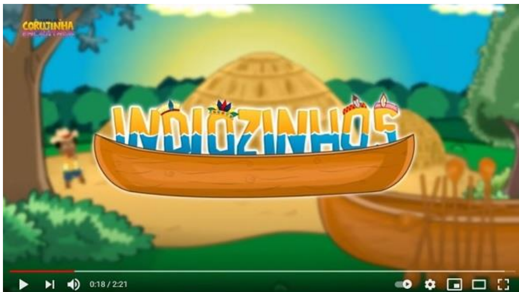
Indiozinhos - Turma da Corujinha Encantada

DISPONÍVEL EM: https://www.youtube.com/watch?v=4XNRxD9JuSY