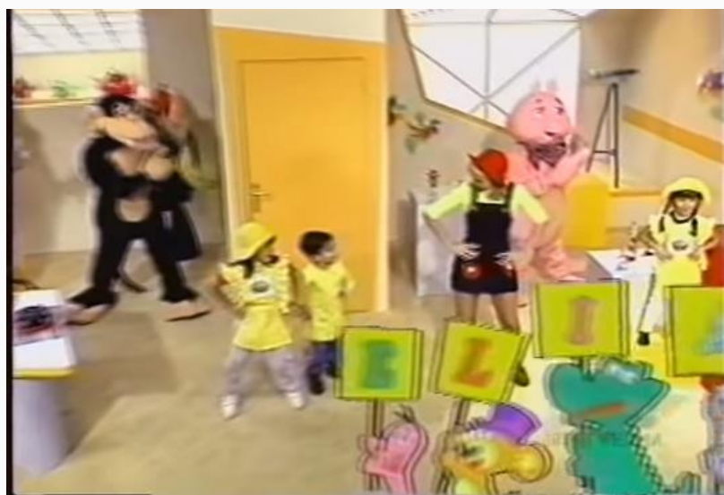
Eliana - A dança dos bichos - 1996 - Início do Eliana & Cia

LINK: https://www.youtube.com/watch?v=ufTSWLD on4 ACESSO EM 23/07/2021