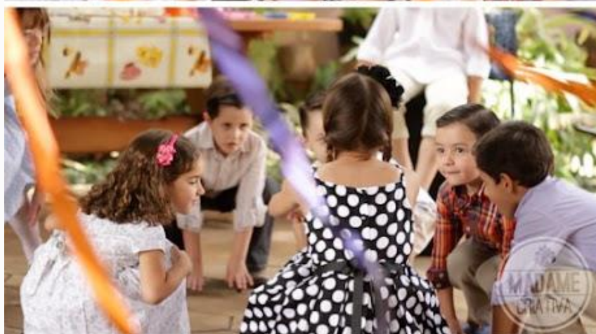
IMAGEM: http://www.madamecriativa.com.br/uploads/1/3/7/1/13714167/1224973_orig.jpg ACESSO EM 26/07/2021

ENVIEM FOTOS, VÍDEOS DE TODAS AS BRINCADEIRAS OU UMA DELAS.