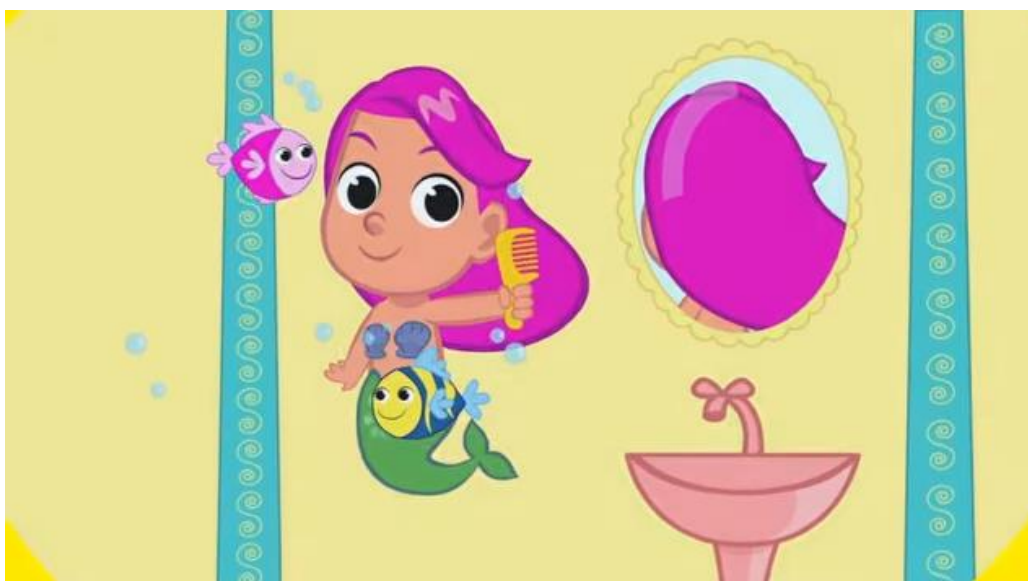
Lenda da Iara Sereia: Turma do Folclore