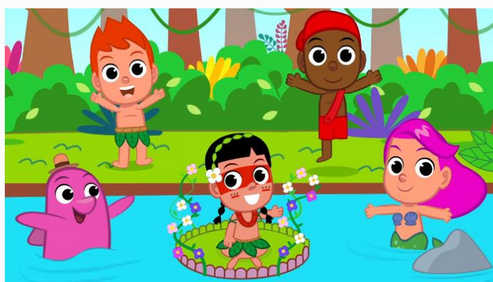
Turma do Folclore: Música do Dia da Água (Saci, Curupira, Caipora, Iara e seus amigos)

https://www.youtube.com/watch?v=0WaKO2fp8sg acesso em 17/08/2021