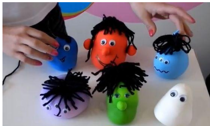
IMAGEM DISPONÍVEL EM : https://i.pinimg.com/564x/94/50/b2/9450b22f8d9458b14949c64f1067daa5.jpg g (ACESSO EM 07/10/2021 AS 08/17 HRS)

ENTÃO, QUE TAL ENSINAR AS CRIANÇAS A FAZER BONEQUINHOS SENSORIAIS APENAS COM BEXIGA E FARINHA? ALÉM DE SER FÁCIL E O RESULTADO FICAR MUITO FOFO, ELES PODEM SER USADOS PARA A ESTIMULAÇÃO TÁTIL, COMO TAMBÉM PARA A PERCEPÇÃO VISUAL DE CORES, FORMAS, TAMANHO E PESO.