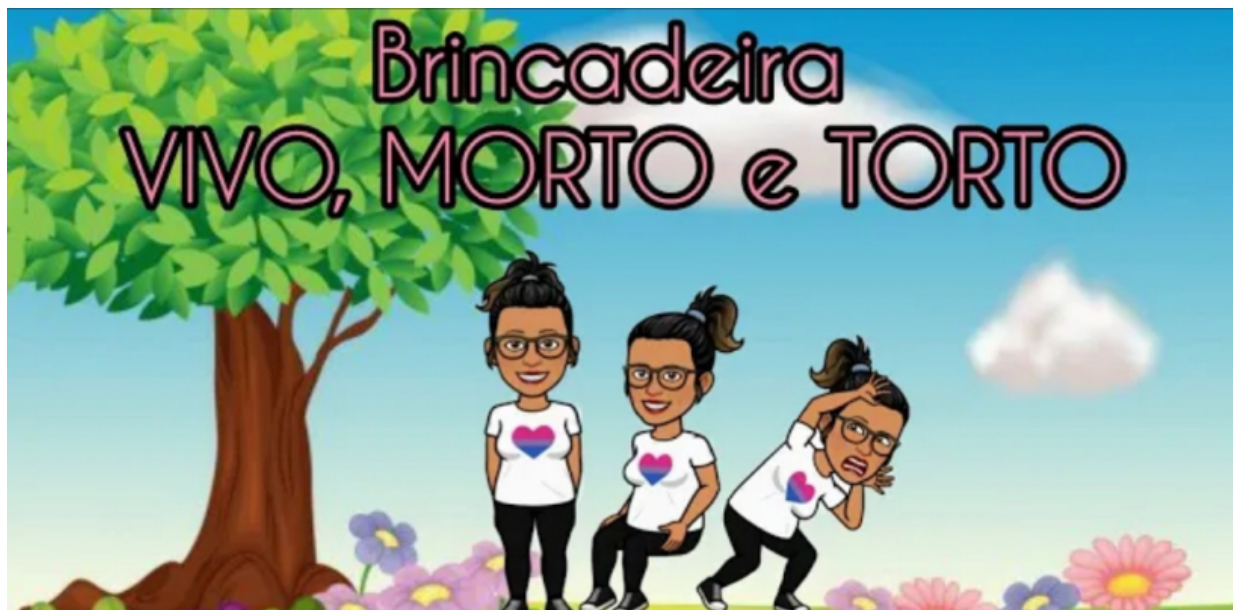
IMAGEM DISPONÍVEL EM:

AGORA VAMOS DANÇAR E SE DIVERTIR COM MUITA ATENÇÃO E CONCENTRAÇÃO!!!