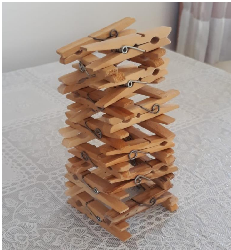
Imagem retirada arquivo pessoal.