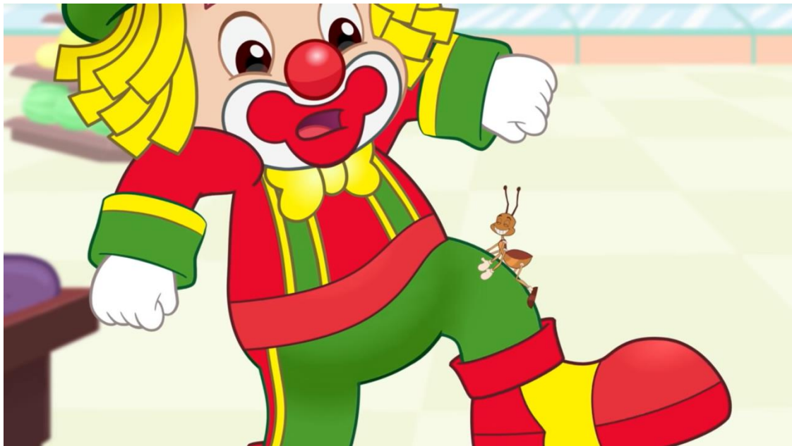
Imagem da internet

https://www.youtube.com/watch?v=HULog5uNlrw