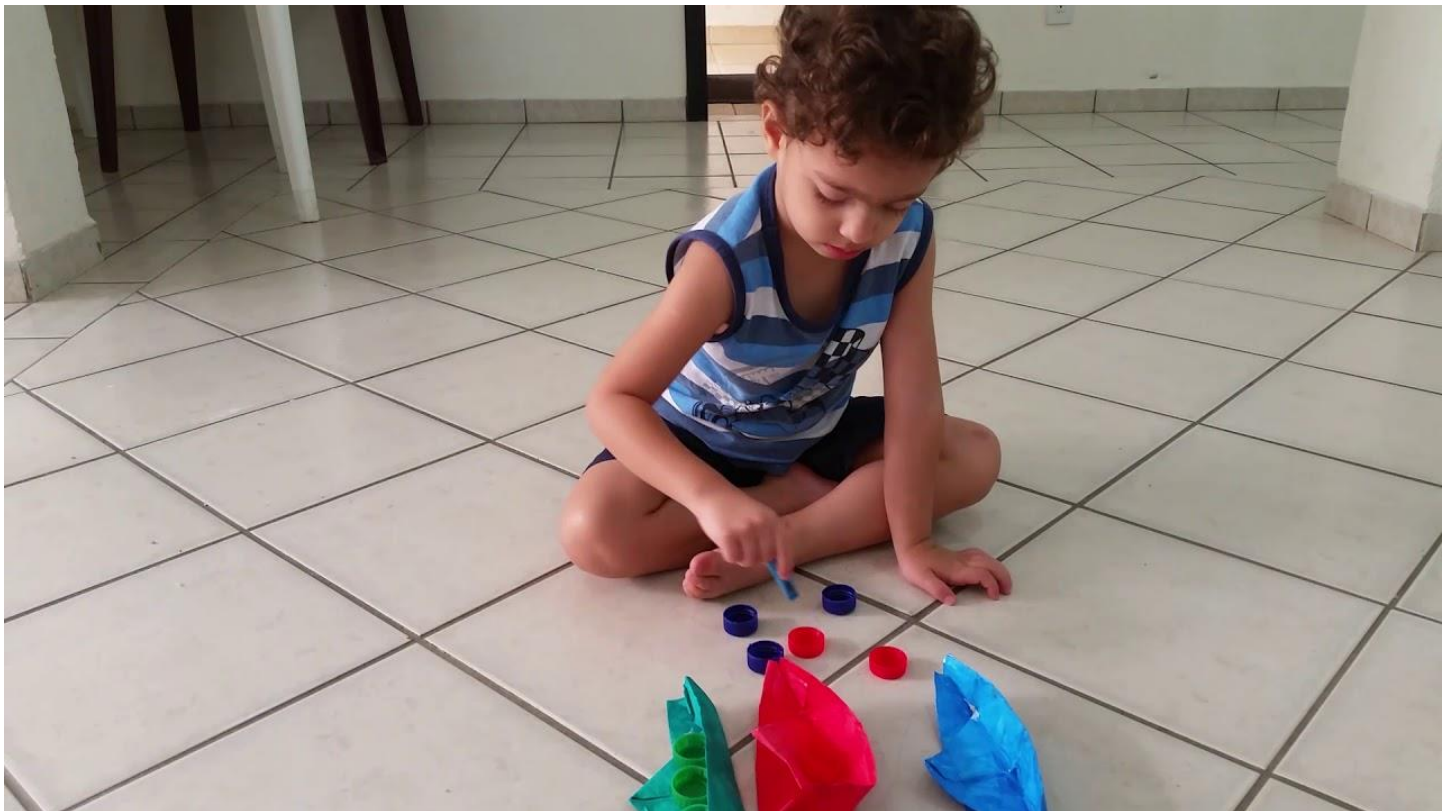
Imagem da internet

Vamos espalhar as tampinhas e ir pedindo para a criança pegar de acordo com as cores solicitadas pelo adulto e ir colocando no recipiente.