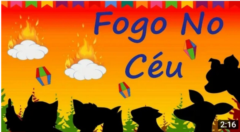
Imagem printada do canal “Mundo Serelepe” – link abaixo

REFLETIR SOBRE OS PERIGOS DE SOLTAR BALÃO