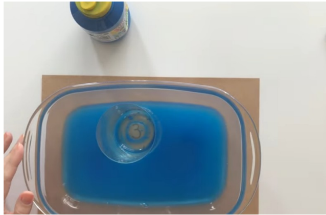
Imagem printada do canal "Professora Lilian Pelegrini" link abaixo