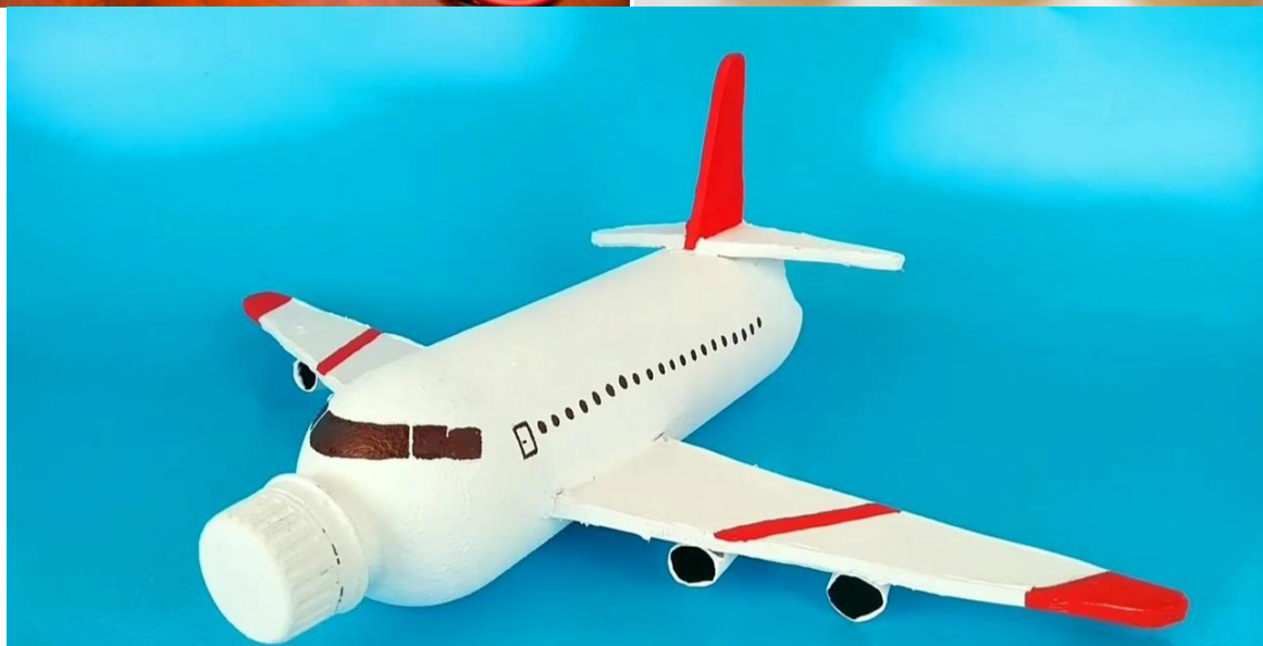
Imagem da internet

Fonte: https://alunoon.com.br/infantil/atividades.php?c=926 acesso em 12/06/21 às 09:25