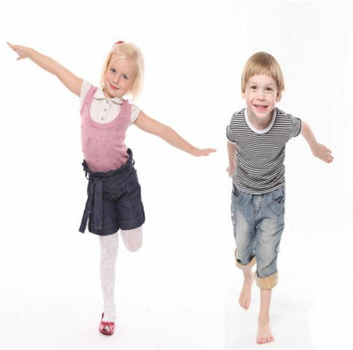
Foto das crianças dançando

A gente vai ter que rodar Roda, roda no lugar Ninguém aqui pode cair E eu vou contar pra terminar 3, 2, 1, estátua!