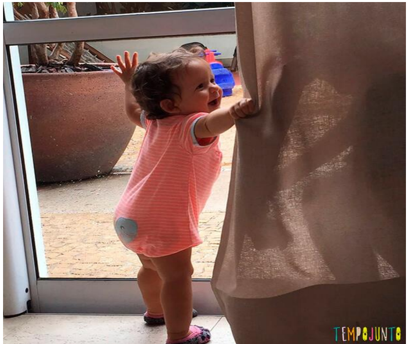
Imagem da criança procurando alguém escondido

Obs.: Assegure-se de estar brincando em um local seguro e livre de coisas que podem cair ou machucar a criança. Verifique a segurança dos possíveis locais que a criança possa querer se esconder, por exemplo, caso a criança queira se esconder debaixo de uma mesa e puxe a toalha da mesa a fim de se cobrir, não pode haver objetos em cima para não correr o risco de se machucar.