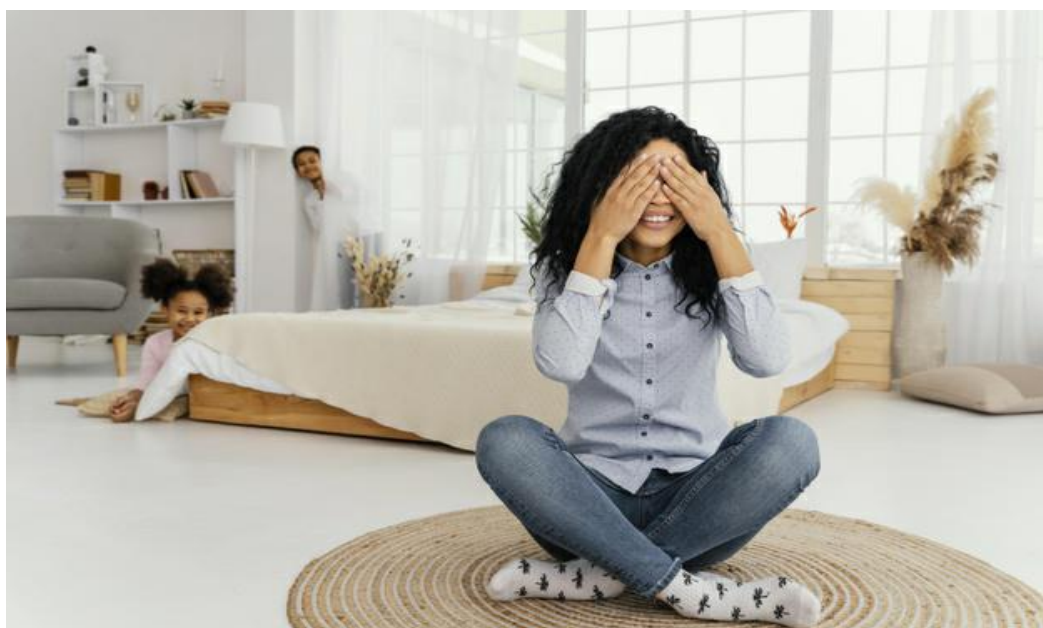
Imagem da mãe brincando de esconde-esconde com os filhos, disponível em https://br.freepik.com/fotos-gratis/vista-frontal-da-mae-sorridente-brincando-de-esconde-esconde-com-os-filhos-em-casa_13108845.htm Acesso em 10/06/2021

Repita a brincadeira e não se preocupe se a criança quiser se esconder no mesmo lugar.