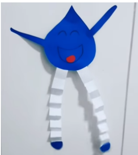
IMAGEM DISPONÍVEL EM: https://i.ytimg.com/vi/WTOQuloQda4/maxresdefault.jpg

- E POR ÚLTIMO FAZER A GOTINHA JUJU: DESENHAR A GOTINHA, PINTAR E RECORTAR; CORTAR DOIS RETÂNGULOS COMPRIDOS E FAZER UM SANFONADO TIPO LEQUE QUE SERÃO AS PERNINHAS; COLE TODAS AS PARTES E FINALIZA DESENHANDO A CARINHA E FAZENDO DOIS LINDOS BRACINHOS.