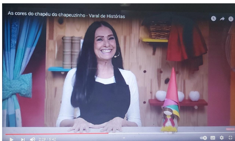
IMAGEM PRINTADA DO CANAL “VARAL DE HISTÓRIAS” NO YOUTUBE – LINK: https://www.youtube.com/watch?v=oUHI_5jPKAg ACESSO NO DIA 12/08/2021, AS 18:00 HRS.