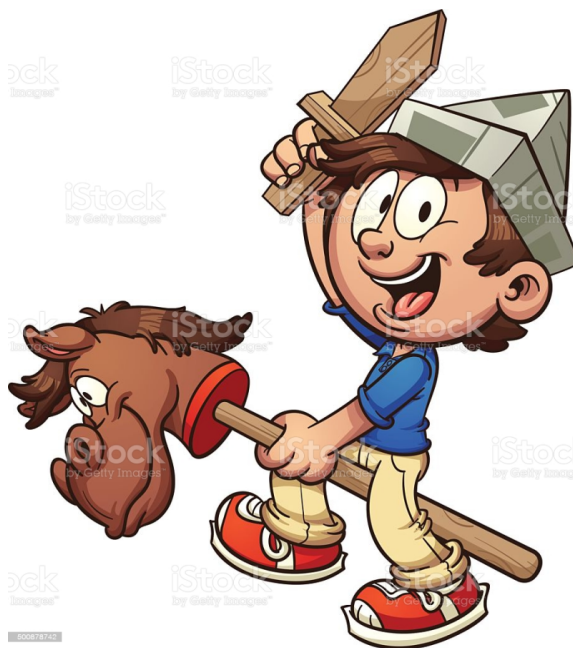
IMAGEM DISPONIVÉL EM:

-GRAVE UM VÍDEO OU TIRE FOTO E MANDE PARA SUA PROFESSOR.