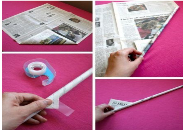
IMAGEM DISPONIVEL NO LINK:

CANUDO MUITO FINO PARA A LÂMINA DE SUA ESPADA E SIM UM CILINDRO MAIS ESPESSO.