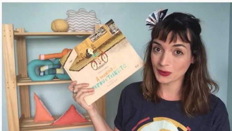
A MENINA QUE PAROU O TRÂNSITO - história de acumulação | Fafá Conta

Carros e ônibus num vaivém furioso, motos em zigue-zague, gente andando feito barata tonta. A vida roda acelerada nas calçadas, ruas e avenidas. Mas uma menina e sua bicicleta vão propor uma pausa no ritmo frenético da cidade grande.