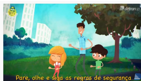
© SÃO PAULO Clube do Bem-te-vi: pare, olhe e siga as regras de segurança!

https://www.youtube.com/watch?v=XBmpHyiTVA4 .