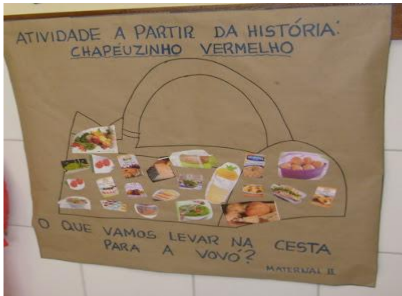
Imagem disponível em:

Segue imagem de um cartaz como sugestão: