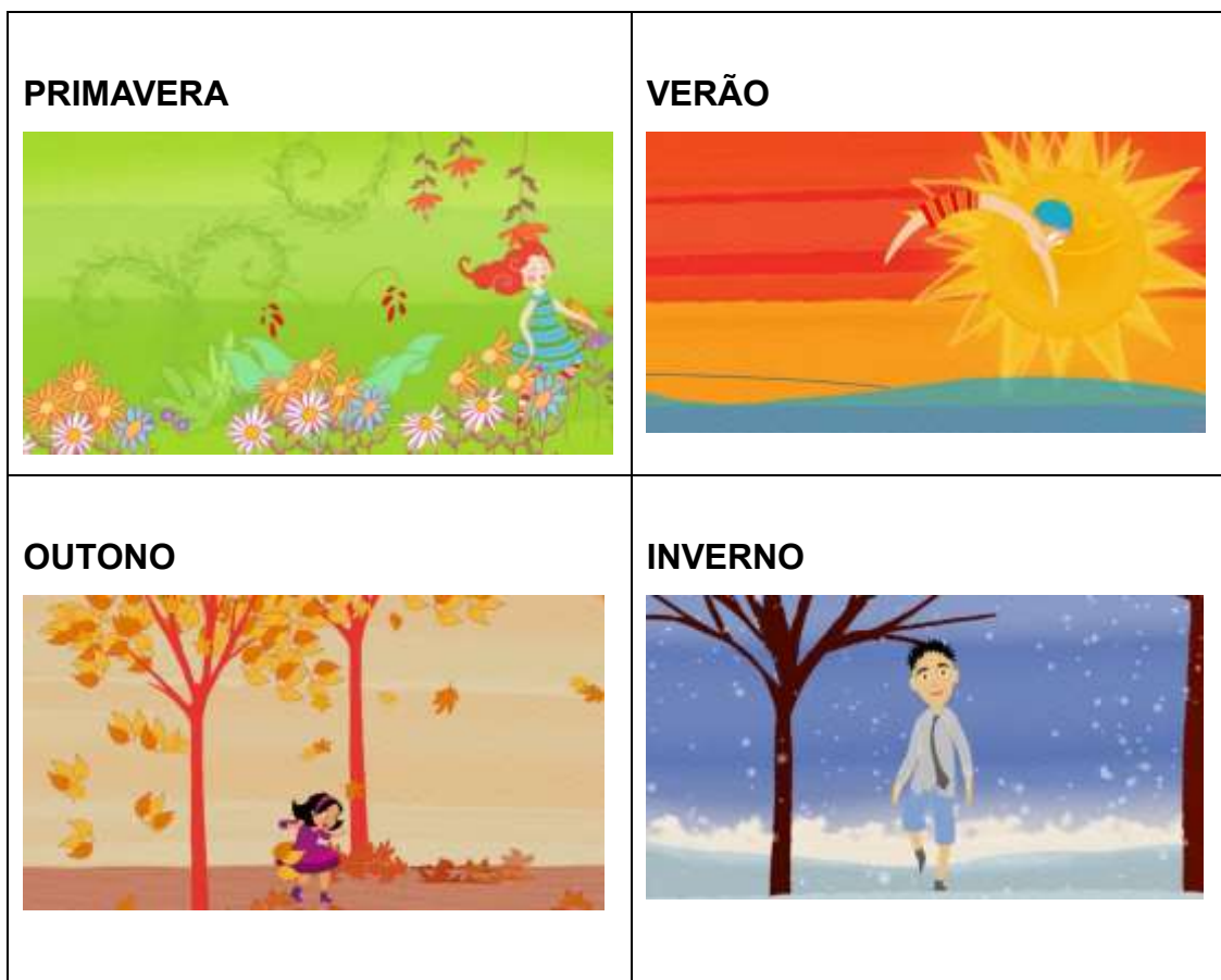
Imagem retirada do canal "Palavra cantada" Link acima

Após assistir o vídeo, apresente a foto abaixo e converse com a criança sobre as características das quatro estações que aparecem no vídeo. Explique também que estamos no inverno, época onde as temperaturas caem e por isso é muito importante se agasalhar.