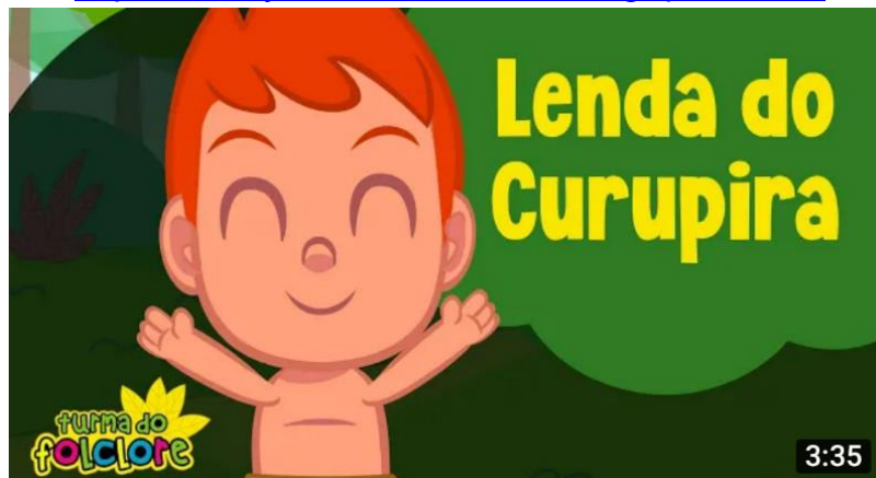
Imagem retirada do canal “Turma do folclore” link acima

https://www.youtube.com/watch?v=gKpilzfNQA8