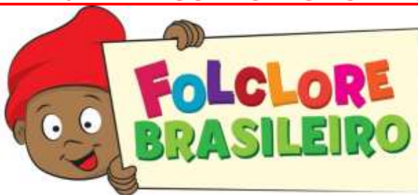
Imagem disponível em: https://www.empev.com.br/2018/08/o-dia-do-folclore-brasileiro-e.html acesso 11/08/21