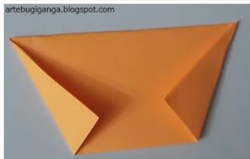
2 - O PRIMEIRO QUADRADO, DOBRE AO MEIO E DEPOIS DOBRE AS PONTAS PARA DENTRO.