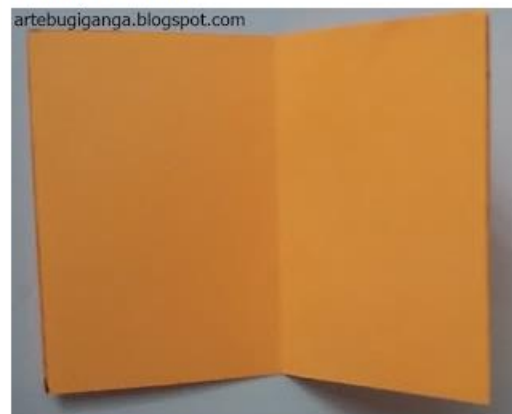
3 - O SEGUNDO QUADRADO, DOBRE AO MEIO E DEPOIS DOBRE AO MEIO MAIS UMA VEZ.