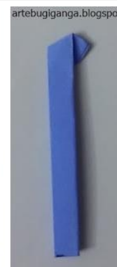
6 - DOBRE A PONTA E ESTÁ PRONTA A CHAMINÉ.