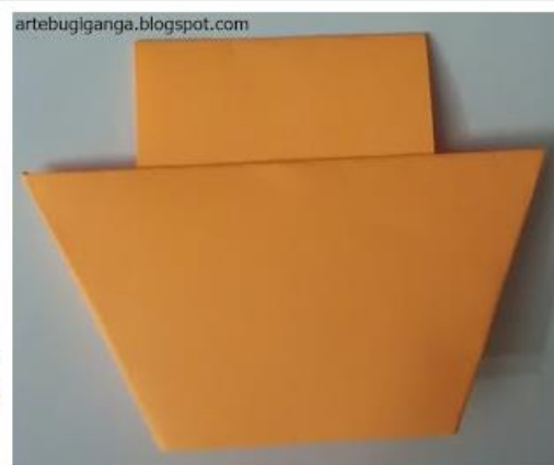
4 - COLE UM ATRÁS DO OUTRO.