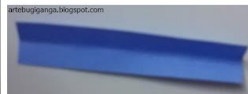
5 - RECORTE UMA TIRA RETANGULAR E DOBRE AO MEIO.