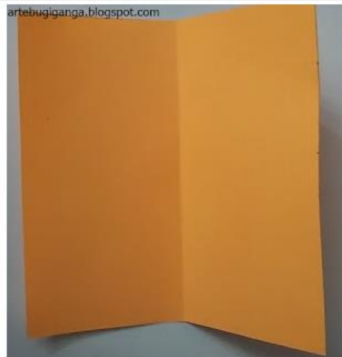
1 - RECORTE DOIS QUADRADOS