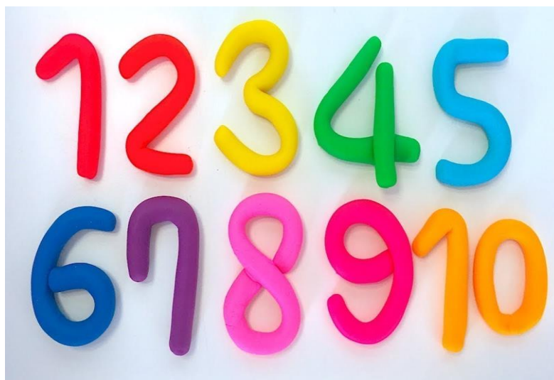
números com massinha de modelar imagens

DESENVOLVIMENTO: clicar no link abaixo da figura para assistir o vídeo.