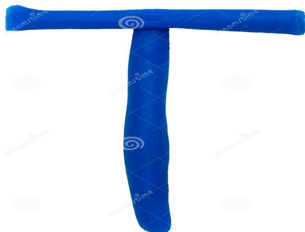
imagem da internet.