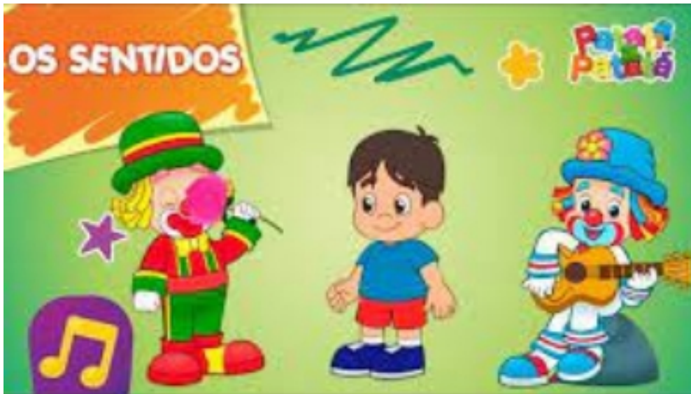
Patati Patatá - Os Sentidos (DVD O Melhor da Pré-escola)

Descrição da atividade: Assistir ao vídeo musical OS SENTIDOS - PATATI E PATATÁ - Explorar com o bebê os órgãos do sentido olhos, mãos, boca, ouvido e nariz, no momento da música mostre pra ele os órgão apontando em você e depois nele e incentive-o a apontar sozinho e/ou falar o nome do órgão.