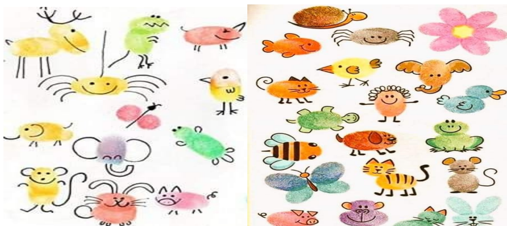
Kids arts& craft

Pais nestas atividades é importante nomear com seu filho os nomes dos animais e as cores, assim vão assimilando e fazendo o reconhecimento (cores e animais) e ampliando o vocabulário