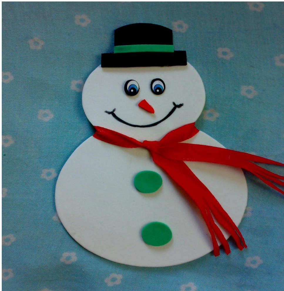
IMAGEM DA INTERNET, ACESSO EM 02/09/2021, as 14:00.

DESCRIÇÃO DA ATIVIDADE: COM A AJUDA DE UM ADULTO RECORTAR DOIS CIRCULOS, UM MAIOR O OUTRO MENOR, COLAR UM SOBRE UMA PARTE DO OUTRO, FICANDO O MENOR EM CIMA, E O MAIOR EMBAIXO, FIRMANDO CABEÇA E CORPO, DESENHE OS OLHOS, NARIZ E BOCA, DEPOIS ENFEITE COMO QUISER, COLE OS BOTÕES, FAÇA O CACHECOL, O CHAPEU, E SE PREFERIR COLE NA PARTE DE TRÁS UM PALITO DE SORVETE, E BRINQUE COMO UM FANTOCHE.