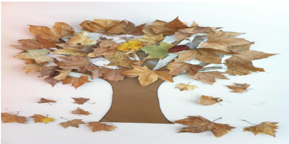
IMAGEM RETIRADA DA INTERNET

DESCRIÇÃO DA ATIVIDADE: EM UMA FOLHA, E COM O AUXÍLIO DE UM ADULTO, OU AINDA A PRÓPRIA CRIANÇA, DESENHAR UMA ÁRVORE COM UMA COPA GRANDE, PREENCHER TODOS OS ESPAÇOS COM COLA, E EM SEGUIDA, ESFARELAR AS FOLHAS SECAS EM CIMA DA PARTE EM QUE ESTÁ COM COLA, ENTÃO OBSERVE COMO AS ÁRVORES FICAM NO INVERNO, AGORA POR CIMA DAS FOLHAS IR COLOCANDO FIOS DE ALGODÃO, ATÉ QUE FIQUE PARECENDO COMO SE ESTIVESSE NEVANDO.