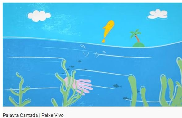
Palavra Cantada | Peixe Vivo

ENTÃO... VAMOS LÁ, 20 MINUTOS POR DIA DESSAS ATIVIDADES, JÁ SÃO O SUFICIENTE PARA NOSSOS PEQUENOS.