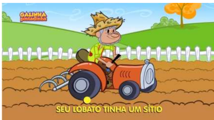
Imagem extraída do vídeo no Youtube

Atividade 3: Vamos cantar juntos? A música Seu Lobato relembra os animais da fazenda. Assista em: https://www.youtube.com/watch?v=3r4cadv1Cmw