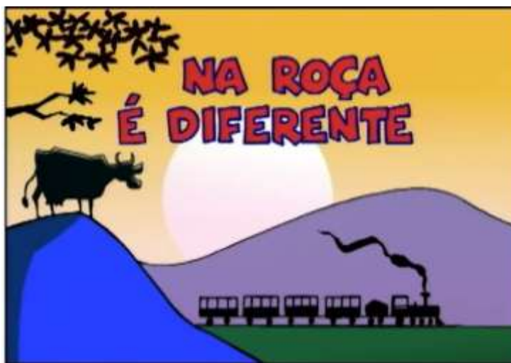
Imagem extraída do vídeo-clipe no Youtube

Assista em: https://www.youtube.com/watch?v=Bfx_E3zvnjc