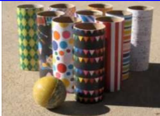
Imagem extraída do vídeo no Youtube.

Assista em: https://www.youtube.com/watch?v=Qu9VKZjN9vw