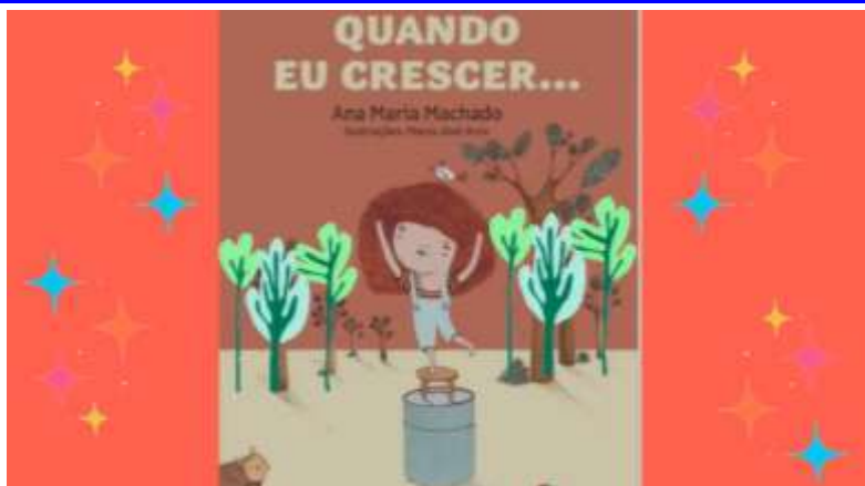
Imagem extraída do vídeo

https://www.youtube.com/watch?v=1ThLB9spJnM