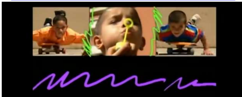
Imagem extraída do vídeo

https://www.youtube.com/watch?v=lgDOXkKSobM