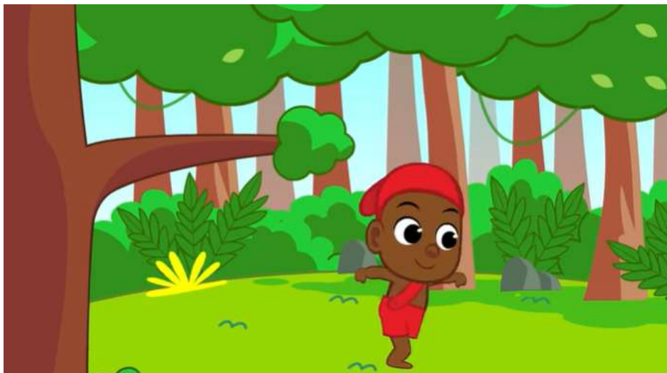
Imagem extraída do vídeo

https://www.youtube.com/watch?v=um1WHr1ejow