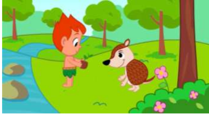
Imagem extraída do vídeo

Atividade 06: Conheça a história do Curupira, este personagem, amigo da natureza que adora brincar na floresta com seus amigos Saci Perere, Iara e Caipora do Folclore Brasileiro. https://www.youtube.com/watch?v=gKpilzfNQA8