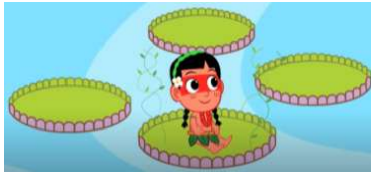
Imagem extraída do vídeo

Envie um vídeo ou áudio da criança comentando sobre a Lenda e o que mais gostou.