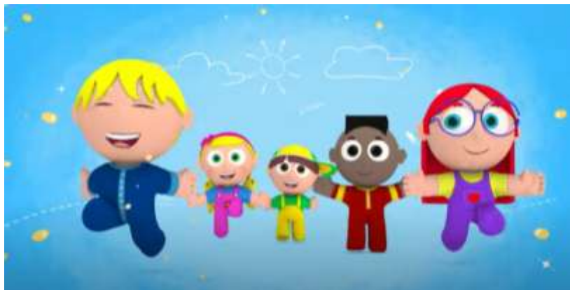
Imagem extraída do vídeo

https://www.youtube.com/watch?v=Gv0Q_W6G3yE