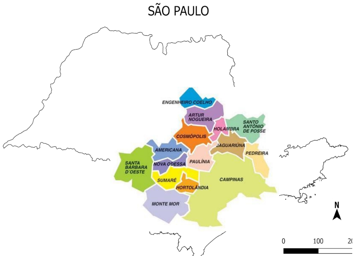
Figura 1 http://www.ahesp.com.br/news/noticia_306 Acesso:27/04/2021

Nesta atividade, o adulto deverá mostrar o mapa do Estado de São Paulo para a criança e pedir para que ela aponte no mapa onde ela imagina que está localizada a cidade de Hortolândia. Logo após mostre a ela ao certo onde se encontra a nossa cidade.