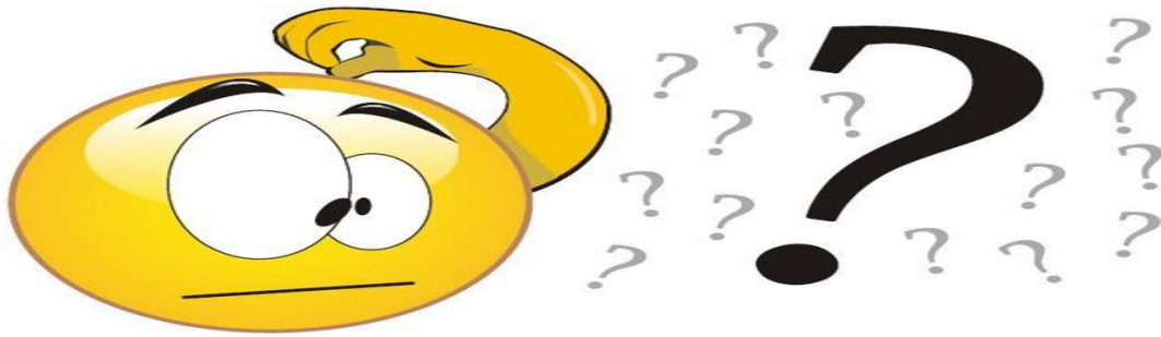
Imagem retirada:< https://www.todamateria.com.br/adivinhas/ > Acesso em:12/05/2021.