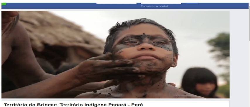
Território do Brincar: Território Indígena Panará - Pará

As crianças indígenas brincam com os elementos da natureza (água, terra, fogo, plantas e pedras)? Pesquise aí na sua casa quais elementos da natureza você tem para brincar e depois anote a data e o nome desses elementos no caderno.