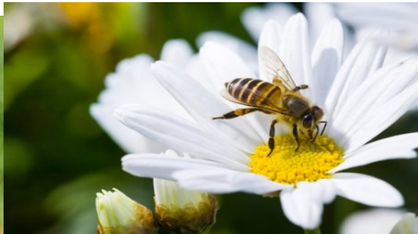
Imagem retirada:< https://meusanimais.com.br/abelhas-sem-elas-nao-haveria-vida/ >Acesso em: 18/06/21.

Imagem retirada: https://ciclovivo.com.br/mao-na-massa/horta/5-jeitos-de-atrair-borboletas-para-o-jardim/ Acesso em:18/06/21.