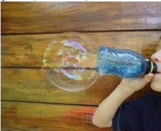
Imagem acesso em :22/06/2021

Um recipiente com um pouco de água e detergente, um canudinho ou uma garrafa pet cortada para fazer as bolhas. Agora é só brincar e se divertir.