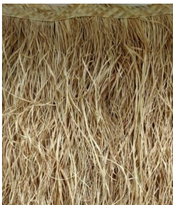
Imagem 2: Palha