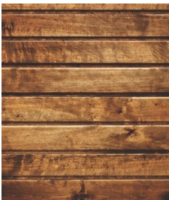
Imagem 1: Madeira